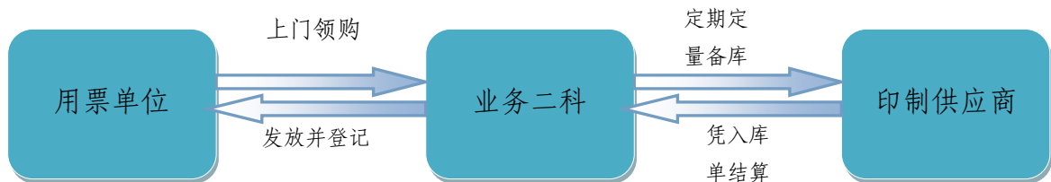
现货供应方式流程示意图：

② 现货供应：通用票据由业务二科定期定量向承印供应商下达印制通知书，注明相关要素，承印供应商按要求完成相应财政票据印制任务，并送达业务二科仓库存放。入库票据种类、数量记录到信息系统，并根据每次入库票据数量开具财政票据入库单。用票单位可直接到业务二科业务窗口办理申领手续。业务二科审核批准并在信息系统中登记领购信息，印制通知书和入库单作为承印供应商向本单位结算印制服务费的依据。