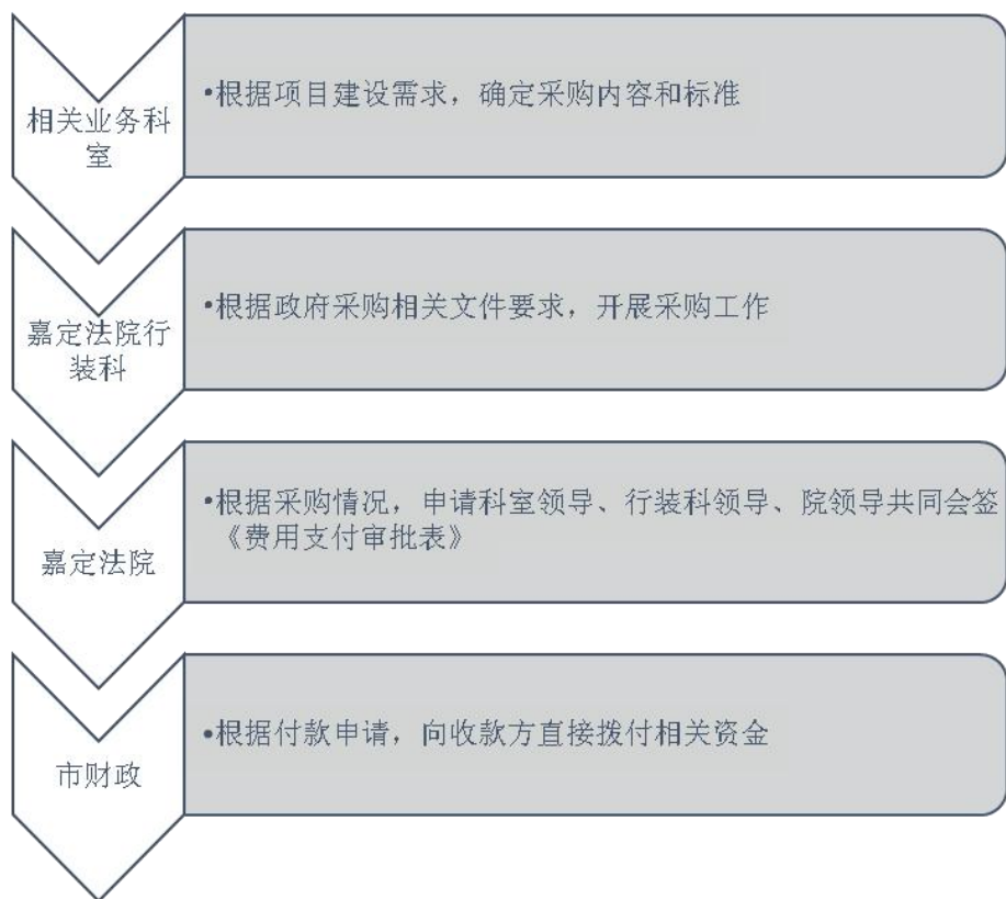
图 1-2 非政府采购类资金拨付流程图