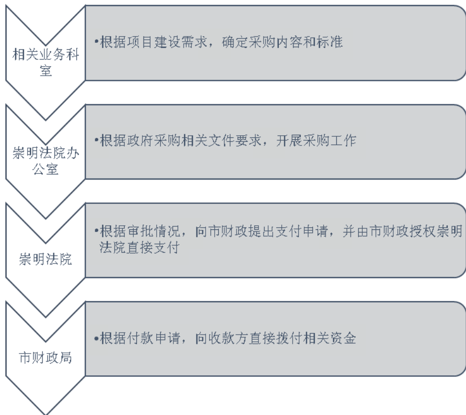
图 1-2 非政府采购类资金拨付流程图