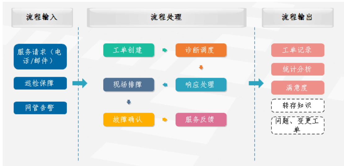
图 1-3 故障管理流程

故障管理流程的流程处理主要包含 6 个主要环节，各个环节的功能定义如表 1-2 所示：