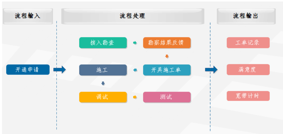
图 1-2 工程接入工作流程