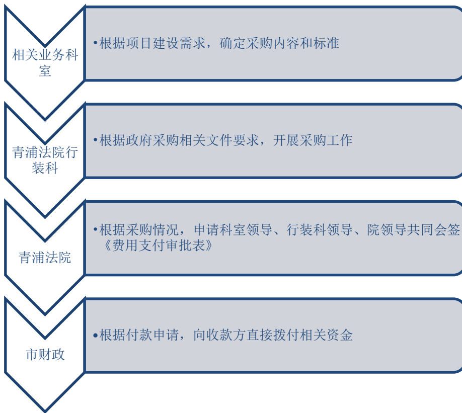
图 1-2 授权支付资金拨付流程图