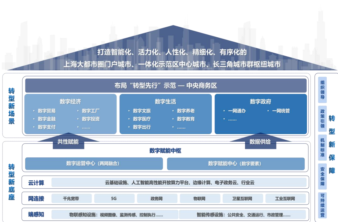
图 1、青浦新城数字化转型整体框架图

--夯实形塑未来、安全坚韧的转型新底座（智能化）： 强调面向未来的“网连接、智通达”“端感知、全透明”“云计算、边协同”的智能基础设施建设，完善数据要素体系，强化数据资源整合，加强数据资源共享，强调数据资源安全，夯实数字技术支撑，构筑数字赋能中枢，形成数据驱动的转型新底座，充分释放数字化蕴含的巨大能量，以数字维度全方位赋能城市迭代进化、加速创新。