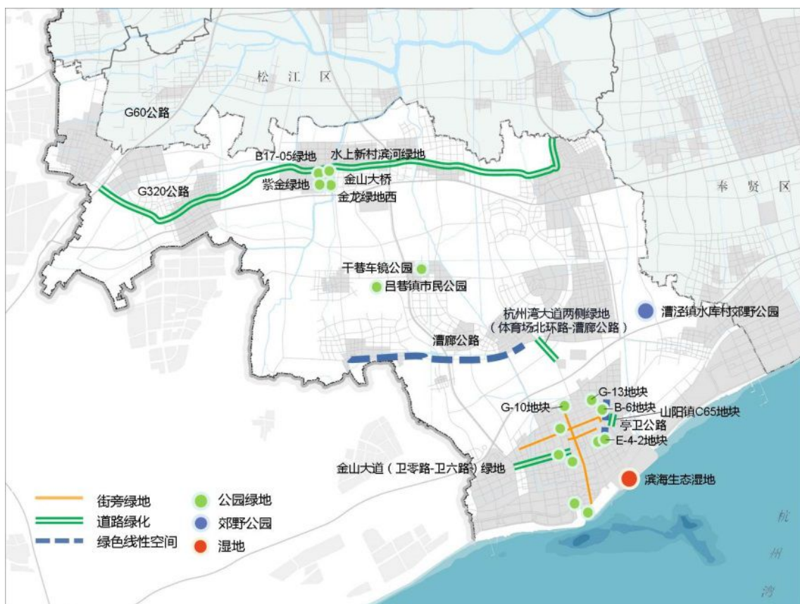
图 1 生态空间规划图