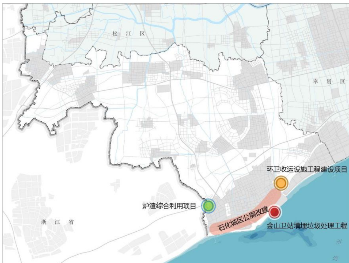
图 2 环卫设施规划图

提升环卫装备技术水平。 加强环卫作业新技术、新装备、新设施的应用。全面提升分类收运设备及小压站和转运站装备密闭性能及污染控制水平，实施垃圾转运站箱体水平改竖压、湿垃圾就地处理设施污水处理达标改造等。强化源头设施设备维护，全面提升设施设备完好率。