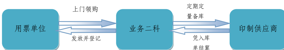
现货供应方式流程示意图:

② 现货供应:通用票据由业务二科定期定量向承印供应商下达印制通知书,注明相关要素,承印供应商按要求完成相应财政票据印制任务,并送达业务二科仓库存放。入库票据种类、数量记录到信息系统。用票单位可直接到业务二科业务窗口办理申领手续。业务二科审核批准后在信息系统中登记领购和发售信息,并根据每次入库票据数量开具财政票据入库单。印制通知书和入库单作为承印供应商向本单位结算印制服务费的依据。