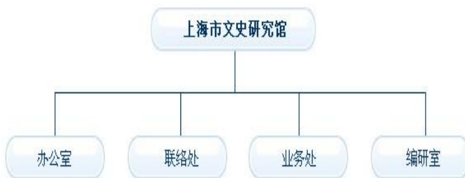
图 1：上海文史馆机构组织图