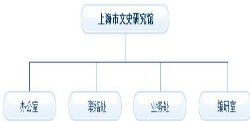
图 2：上海文史馆机构组织图