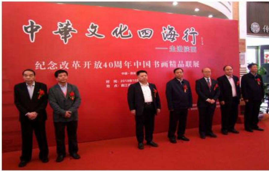
中国书画精品联展开幕式